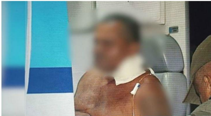
A vítima foi atendida em uma UPA e transferida para o Hospital da Restauração